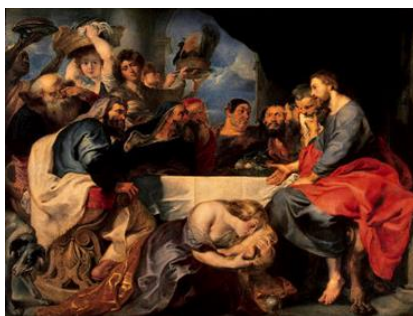
Rubens Cena in casa di Simone il fariseo

Questo popolo mi onora con le labbra, ma il suo cuore è lontano. Gesù indirizza oggi la nostra attenzione verso il cuore, quegli oceani interiori che ci minacciano e che ci generano; che ci sommergono talvolta di ombre e di sofferenze ma che più spesso ancora producono isole di generosità, di bellezza e di luce: siate liberi e sinceri. Gesù veniva dai campi veri del mondo dove piange e ride la vita,