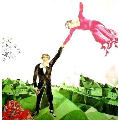
Marc Chagall La passeggiata

È lecito a un marito ripudiare la moglie? È risaputo, tutta la tradizione religiosa, avallata dalla Parola di Dio, lo legittimava: sì, è lecito. Ma Gesù prende le distanze: che cosa vi ha ordinato Mosè? Da ebreo, avrebbe dovuto dire: che cosa "ci" ha ordinato Mosè, invece marca la sua differenza. Mosè ha permesso di scrivere un atto di ripudio. Gesù prende le distanze anche da Mosè: per la durezza